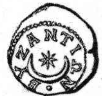
Monedă din perioada târzie a orașului Byzantium, având pe revers o semilună și o stea.