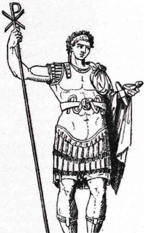
Constantin cel Mare

mare. Constantin a fost un om cu mintea limpede, pe deplin stăpân pe forțele proprii, încrezător în sine și total lipsit de compasiune, asemănător cumva cu mărețul său predecesor, Augustus, dar și cu un suveran care se va naște la multe veacuri după el, și anume, Frederic cel Mare al Prusiei.